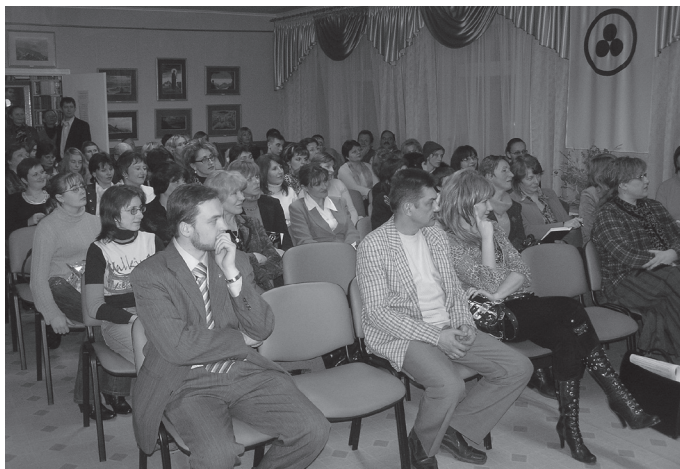
Учасники конференції та співробітники 56-ї Лабораторії Гуманної Педагогіки на зустрічі з Ш. О. Амонашвілі та В. Г. Ніорадзе в Подільському культурно-просвітительському Центрі імені М. К. Реріха.