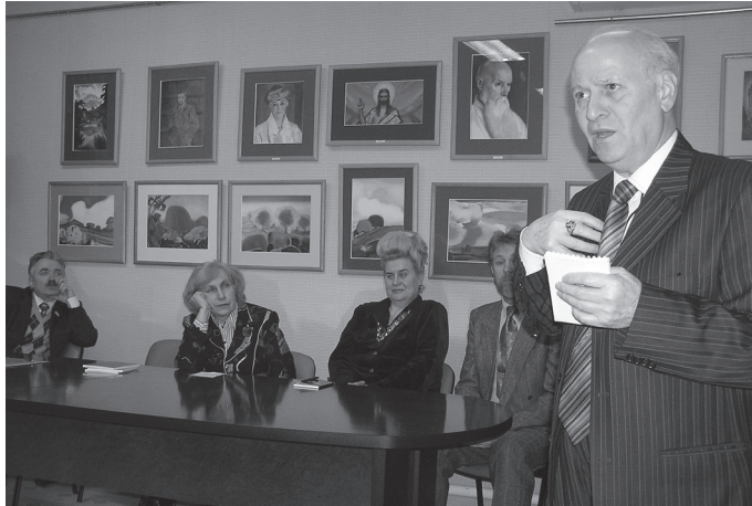
Виступ Ш. О. Амонашвілі на відкритому засіданні 56-ї Лабораторії Гуманної Педагогіки в Подільському культурно-просвітительському Центрі імені М. К. Реріха. За столом у президії сидять (зліва направо): С. В. Вознюк, В. Г. Ніорадзе, Г. М. Сагач, С. Л. Крук.