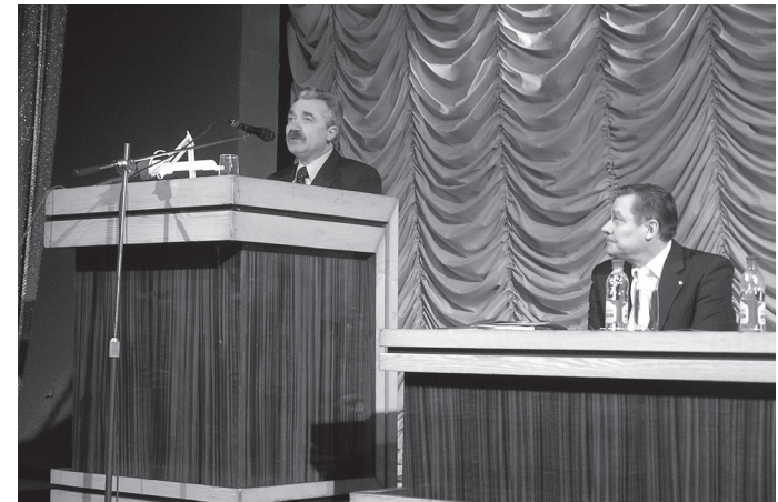
З доповіддю «Освіта області в умовах гуманізації» виступає Сергій Володимирович Вознюк – начальник Управління освіти і науки Хмельницької обласної державної адміністрації.