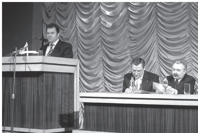
З вітанням учасникам конференції виступає Хмельницький міський голова Сергій Іванович Мельник.