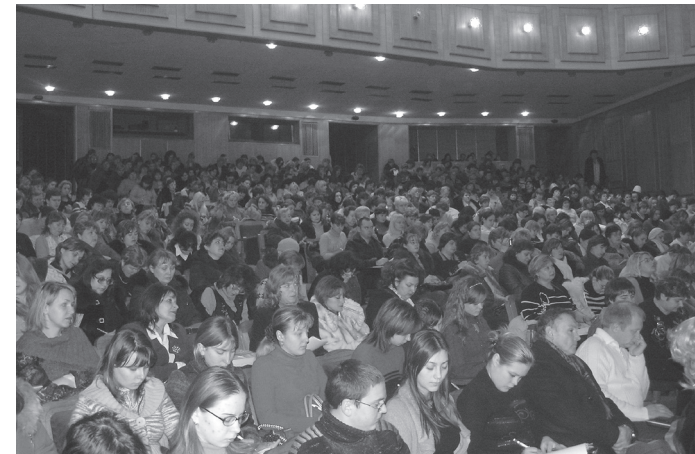
Учасники Всеукраїнської науково-практичної конференції «Педагогіка і психологія в контексті гуманізації освіти» і авторського семінару Ш. О. Амонашвілі в залі Хмельницького обласного музично-драматичного театру імені Г. Петровського.