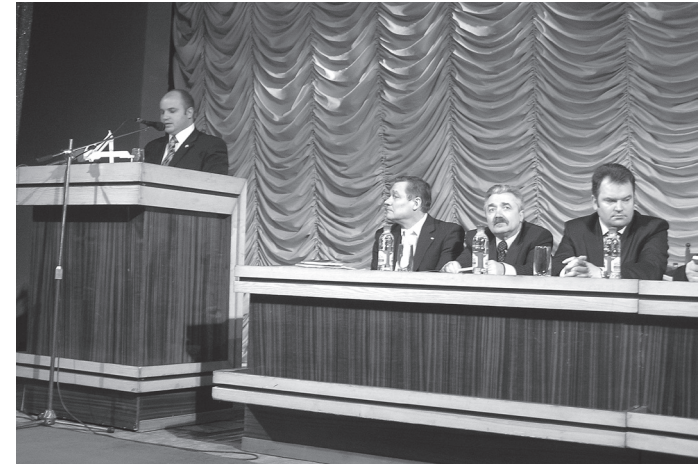
З доповіддю «Орієнтири гуманізації освіти» виступає Олександр Миколайович Буханевич – голова Хмельницької обласної державної адміністрації.